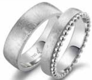
130 | 6.5 mm