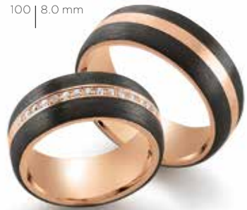
100 | 8.0 mm