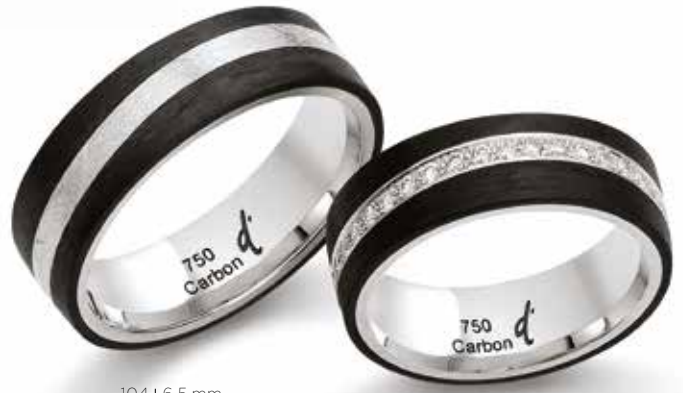
104 | 6.5 mm