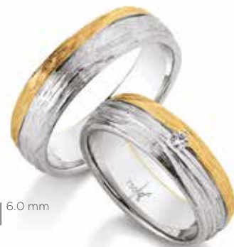
23 | 6,0 mm