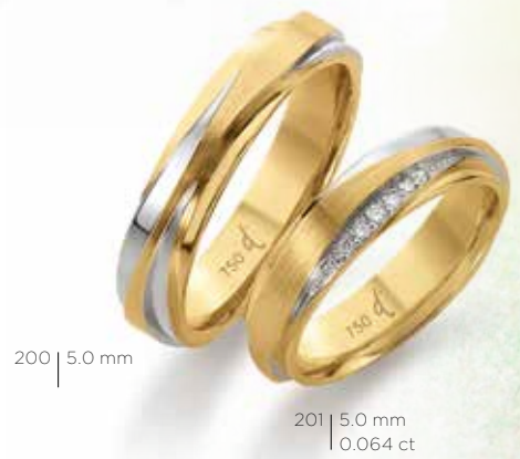
201 | 5.0 mm | 0.064 ct