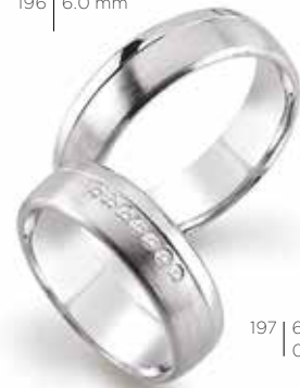
196 | 6.0 mm