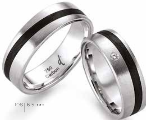
108 | 6.5 mm