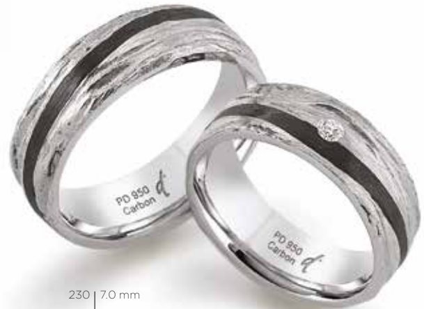
230 | 7.0 mm