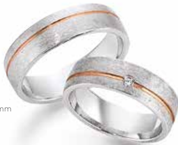
128 | 6.0 mm