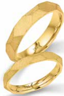
168 | 4.5 mm