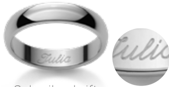
Schreibschrift Ecriture anglaise