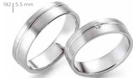
192 | 5.5 mm