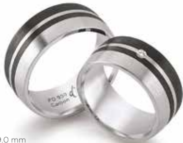
226 | 9.0 mm