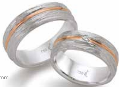
45 | 7.0 mm