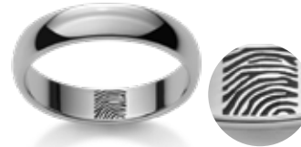
Fingerprint Empreinte digitale