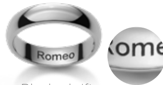
Blockschrift Caractères d'imprimerie