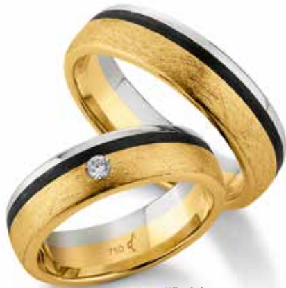
113 | 6.0 mm | 0.050 ct