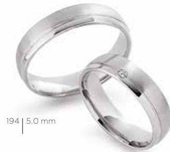
194 | 5.0 mm