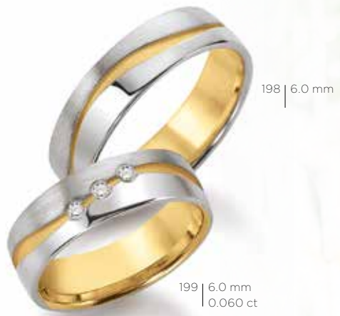
199 | 6.0 mm | 0.060 ct