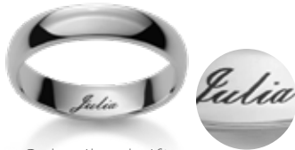
Schreibschrift Ecriture anglaise