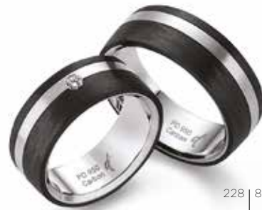
228 | 8.0 mm