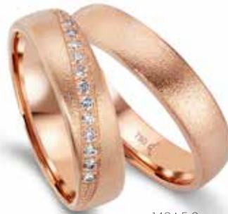
148 | 5.0 mm