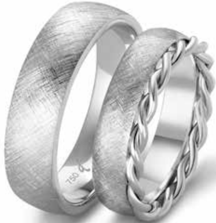
126 | 6.0 mm