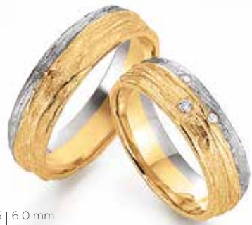
25 | 6,0 mm