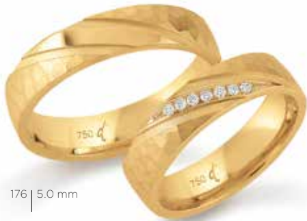
176 | 5.0 mm