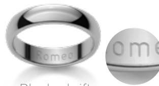
Blockschrift Caractères d'imprimerie