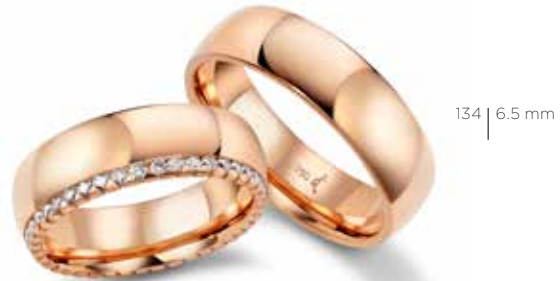
134 | 6.5 mm