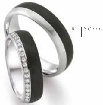
102 | 6.0 mm