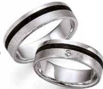
114 | 6.0 mm