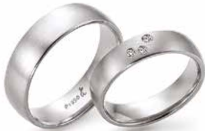
218 | 6.0 mm