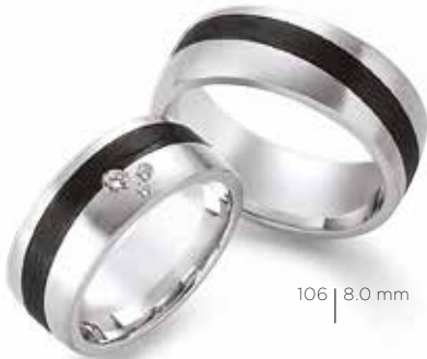
106 | 8.0 mm