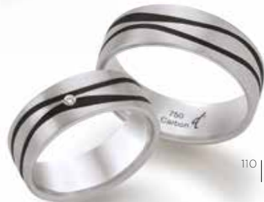
110 | 7.0 mm