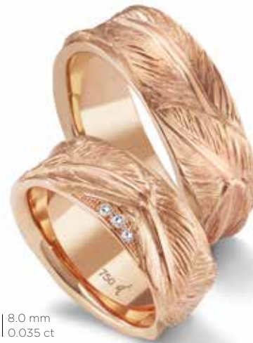
84 | 8.0 mm