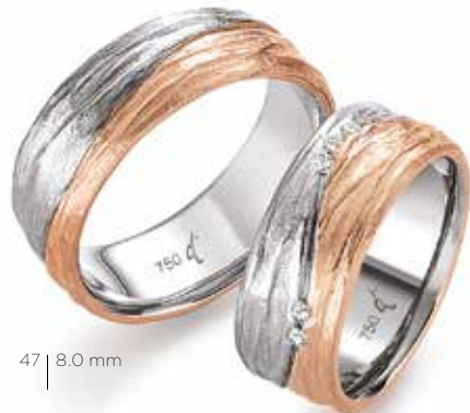
47 | 8.0 mm