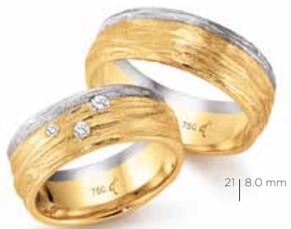
21 | 8,0 mm