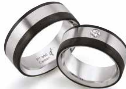
220 | 8.0 mm