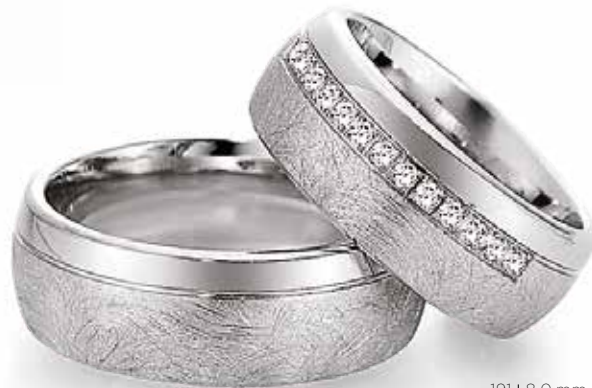
190 | 8.0 mm