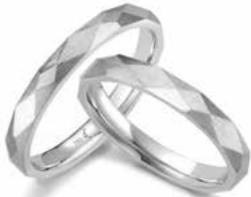
166 | 3.0 mm