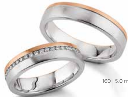
160 | 5.0 mm