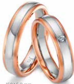
158 | 5.0 mm