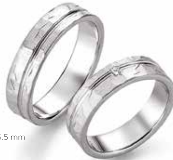
178 | 5.5 mm