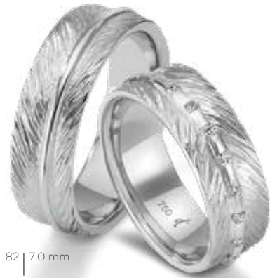
82 | 7.0 mm