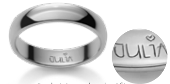
Ihre persönl. Handschrift Votre écriture personnelle