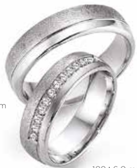
188 | 6.0 mm