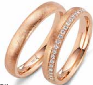
136 | 4.0 mm