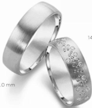
144 | 6.0 mm