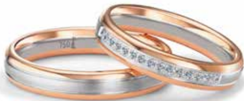
156 | 4.0 mm