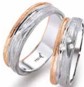
43 | 6.0 mm