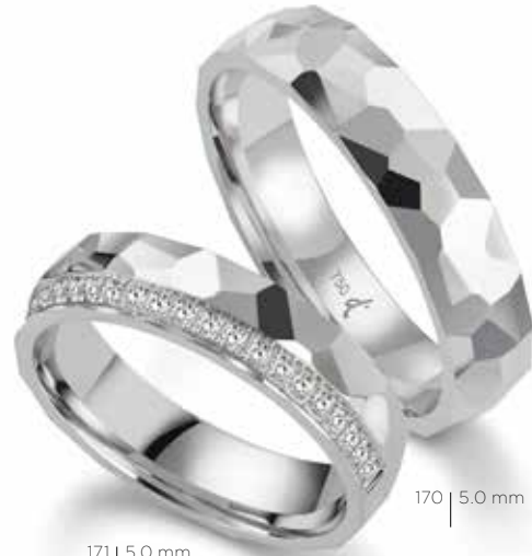
171 | 5.0 mm 0.176 ct